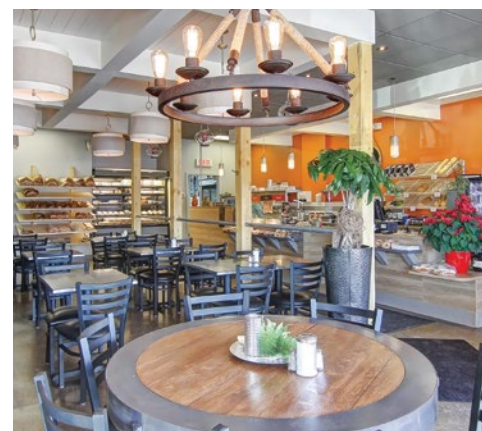
Deux succursales de la Boulangerie Guay pour déguster de délicieux produits maison. À gauche, le 11760, rue Notre-Dame Ouest à Pointe-du-Lac et, à droite, le 5190, boulevard des Forges à Trois-Rivières.